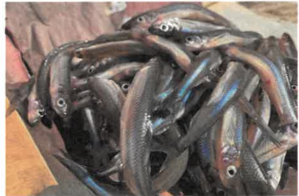
Kuoretta kalastetaan keväisin kutuaikaan mm. Sorvanselän rannoilta ja Kaivannosta. Kuore on tärkeä ravintokala mm. kuhalle ja ahvenelle.

Pyhäjärven viehekalastuslupien hinnat olivat 55 €/vuosi, 35 €/vuosi/3 vapaa, 18 €/7 vrk ja 10 €/3 vrk. Yhtenäislupia myytiin 445 kpl (422 kpl v. 2023, 434 v. 2022 ja 444 v. 2021). Luvanmyynnistä kertyi bruttona 13 271,61 € (alv 0) (11 909,68 € v. 2023). Luvat olivat myynnissä Kalapassin kautta.