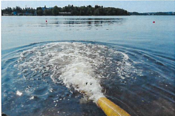
Pyhäjärven pohjoisosan velvoiteistutukset ovat merkittäviä. Alueelle istutetaan planktonsiikaa, kirjolohta, järvitaimenta ja ankeriaita.

Osallistuttiin Laajanojan kalatiehankkeen alustavaan katselmukseen Nokian Tehdassaareissa ja suunniteltiin Nokian kaupungin ja ELY-keskuksen kanssa mahdollisia toimia Laajanojan ylemmän nousues- teen ohittamiseksi.