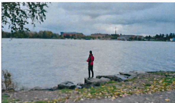
Ratinanvuolteen alajuoksu on suosittu kalastuspaikka Tampereen keskustan tuntumassa.

Vuoden 2021 korvaukset (59 105 €) tilitettiin huhtikuussa niille vesialueiden omistajille, joiden korvaussumma oli yli 50 € ja joiden pankkitili oli kalatalousalueen tiedossa. Omistajakorvausten jakolaskelma tehtiin sähköisen KALPA-palvelun kautta.