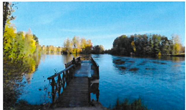
Herralankoskessa riitti virtaamaa syksyllä 2023.

Osallistuttiin pyyntipaikkojen katselmukseen mahdollisten ankeriaan ylisiirtojen toteuttamiseksi.