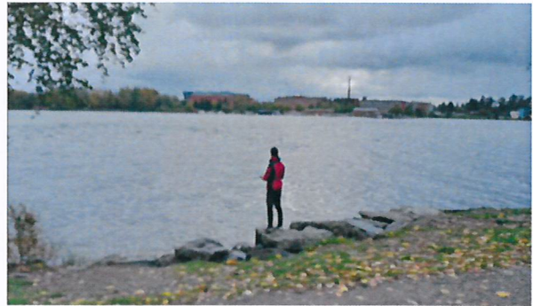
Ratinanvuolteen alajuoksu on suosittu kalastuspaikka Tampereen keskustan tuntumassa.

Vuoden 2021 korvaukset (59 105 €) tilitettiin huhtikuussa niille vesialueiden omistajille, joiden korvaussumma oli yli 50 € ja joiden pankkitili oli kalatalousalueen tiedossa. Omistajakorvausten jakolaskelma tehtiin sähköisen KALPA-palvelun kautta.