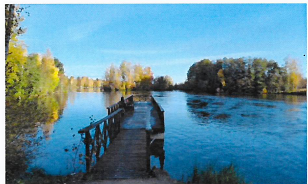
Herralankoskessa riitti virtaamaa syksyllä 2023.

Osallistuttiin pyyntipaikkojen katselmukseen mah- dollisten ankeriaan ylisiirtojen toteuttamiseksi.