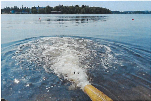
Pyhäjärven pohjoisosan velvoiteistutukset ovat merkittäviä. Alueelle istutetaan planktonsiikaa, kirjolohta, järvitaimenta ja ankeriaita.

Osallistuttiin Laajanojan kalatiehankkeen alustavaan katselmukseen Nokian Tehdassaressa ja suunnitel- tiin Nokian kaupungin ja ELY-keskuksen kanssa mahdollisia toimia Laajanojan ylemmän nousues- teen ohittamiseksi.