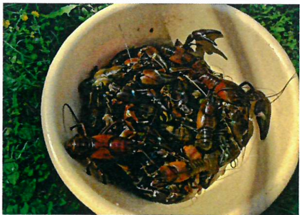
Ravustuskausi 2022 antoi hyviä täplärapusaaliita.

Jyväskylän yliopiston vetämä kuhan ja särjen hor- monitutkimushanke jatkui. Kalatalousalue oli mu- kana hankkeessa, jossa kohdejärvenä oli Pyhäjärvi ja vertailujärvenä Näsijärvi. Loppuraportti valmistuu vuonna 2023.