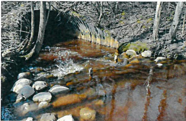
Tampereen kaupunki on kunnostanut Vihojaa mm. hauen lisääntymisen parantamiseksi.

Valmisteltiin Haukihankkeen käytännön toimenpiteiden käynnistämistä yhdessä Kokemäenjoen yläosan ja Kyrösjärven kalatalousalueiden kanssa.