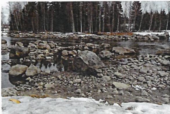
Säännöstely puhuttaa. Herralankoskessa oli vedet vähissä viime keväänä.

Pidettiin 19.4.2022 Nokialla Kerholassa. Kokouksessa oli läsnä 15 äänivaltaista edustajaa, ja siinä käsiteltiin vuosikokoukselle kuuluvat asiat, päätettiin vuoden 2021 omistajakorvausten (59 105 €) jakopuoleista ja vahvistettiin vuoden 2023 yhtenäislupahinnat.