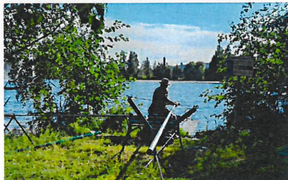
Pahalampi on erikoiskohde ongintaan Tampereen Viinikassa. Pahalammien lajeihin kuuluvat mm. karppi ja suutari, ja siellä pidetään kesäisin ongintakilpailuja, joiden osanottajien varusteisiin kuuluvat erityiset ongintatuolit ja pitkät vavat rullaustelineineen.

Pyhäjärven viehekalastuslupien hinnat olivat 50 €/vuosi, 30 €/vuosi/3 vapaa, 18 €/7 vrk ja 10 €/3 vrk. Yhtenäislupia myytiin 434 kpl (444 kpl v. 2021 ja 522 kpl v. 2020). Luvanmyynnistä kertyi bruttona 12 600,00 € (alv 0) (14 193,54 € v. 2021 ja 15 601,61 € v. 2020). Yhtenäislupien tuotto laski edellisestä vuodesta 11 %. Lasku johtuu siitä, että peräti 41 % vuosiluvan ostaneista hankki uutena lupavaihtoehtona käyttöön otetun halvemman 3 vavan luvan ja ostettujen lupien kokonaismäärä hieman putosi. Luvat olivat myynnissä Kalapassin kautta.