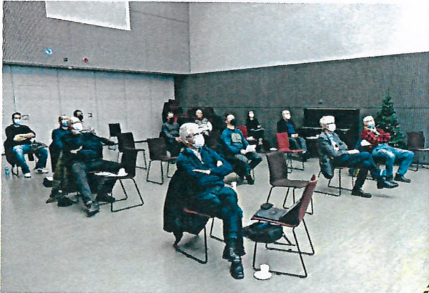
Yleiskokouksessa Virran Hiomo-salissa pidettiin turvavälejä ja kasvomaskeja.

Pidettiin 8.12.2021 Nokialla kirjastotalo Virrassa. 16 äänivaltaisen edustajan läsnä ollessa kokouksessa käsiteltiin vuosikokoukselle kuuluvat asiat, vahvistettiin käyttö- ja hoitosuunnitelma vuosille 2022–2031, päätettiin vuoden 2020 omistajakorvausten (50 158 €) jakoperuste-esityksestä ja vahvistettiin vuoden 2022 yhtenäislupahinnat.