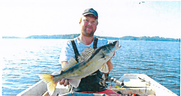
Erityisen paljon käyttö- ja hoitosuunnittelussa puhuttivat kuhan kalastuksen säätelyyn liittyvät asiat ja kaupalliseen kalastukseen hyvin soveltuvien alueiden määrittely.

Pyhäjärven viehekalastuslupien hinnat olivat 50 €/vuosi, 18 €/7 vrk ja 10 €/3 vrk. Yhtenäislupia myytiin 444 kpl (522 kpl v. 2020 ja 412 kpl v. 2019). Luvanmyynnistä kertyi bruttona 14 193,54 € (alv 0) (15 601,61 € v. 2020 ja 12 522,58 € v. 2019). Yhtenäislupien menekki laski edellisestä vuodesta erityisesti 3 vrk:n lyhytlupien osalta. 1. koronavuosi näyttää jääneen jonkinlaiseksi väliaikaiseksi huipentumaksi satunnaisempien kalastajien kalastusinnostuksen osalta. Luvat ovat myynnissä Kalapassin kautta.