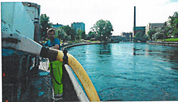
Tampereen kaupunki vastaa Tammerkosken kalastuksen järjestämisestä ja kalaistutuksista. Kirjolohta istutetaan kerran kuussa. Lisäksi koskeen menee velvoitekalaa.

Käyttö- ja hoitosuunnitelmassa on määritelty ne lajit, joita voidaan käyttää istutuksiin kalatalousalueella. Suunnitelman mukaan kuhaistutukset eivät ole sallittuja Pyhäjärven ja Vanajaveden reittiveteen, jonne myöskään peled-siika- ja muikkuistutuksia ei tule tehdä. Suunnitelmassa otettiin kantaa myös velvoiteistutuksiin, joista myös lausuttiin ELY-keskukselle ja kommentoitiin velvoiteistutusten toteutusta meillä olevilla velvoitehoitokausilla.