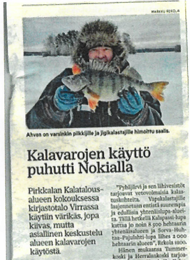
Lehtileike Nokian Uutisista 30.12.2021.

joiden yhteydessä tarkastettiin 129 kalastajaa ja 606 pyydystä. Kalastajilla luvat olivat kunnossa 88 %:sti, pyydyksistä 92 % oli luvallisia. Luvattomien pyydysten osuus nousi edellisestä vuodesta 5 %.