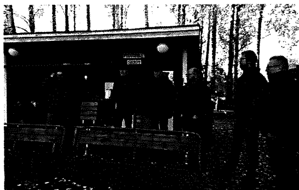
Kalatalousalueen hallitus tutustui lokakuisen kokouksensa yhteydessä Herralankosken kalastusalueeseen Lempäälässä, joka on yksi kalastuksellisista kärkikohteista kalatalousalueella.

Pirkanmaan Kalatalouskeskus ry ja Kokemäenjoen vesistön vesiensuojeluyhdistys ry.